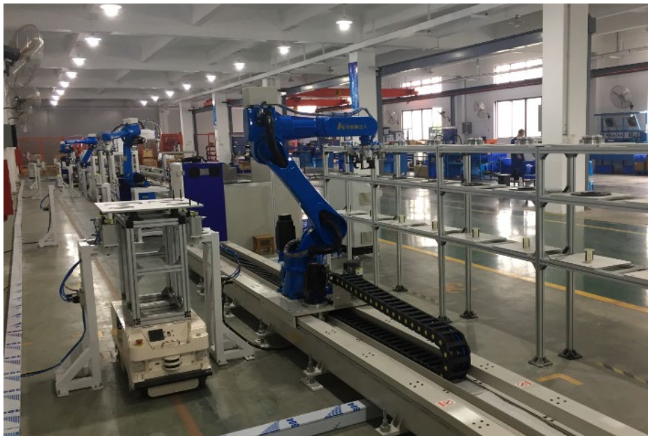
图 10 与华数机器人公司共建智能制造公共实训中心