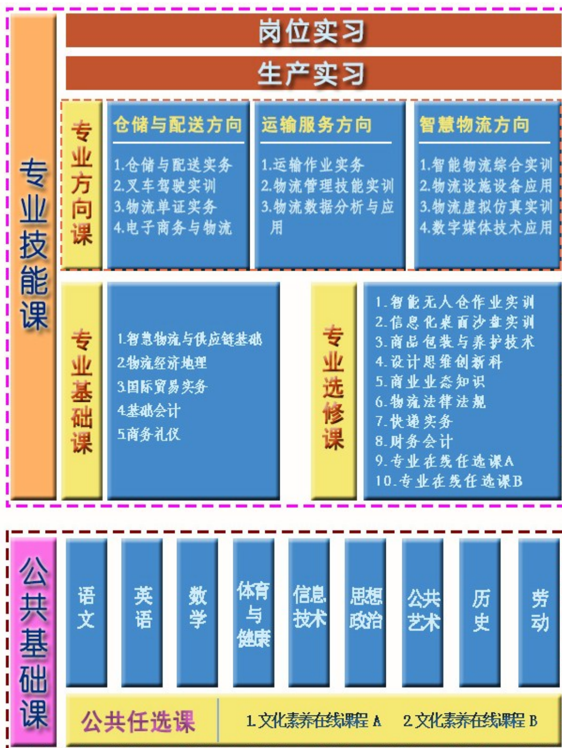
图 3：物流服务与管理专业课程结构体系

想政治课，文化课，体育与健康，艺术等。专业（技能）课包括专业基础课、专业方向（技能）课、专业选修课以及实习实训课。