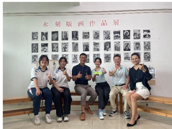
佛山电视台《小强热线》专访考入本科的学生、家长代表

在 2019 级 1181 名毕业生中，有 1091 名同学通过中高职衔接三二分段、五年一贯制、职教高考、对口单招、技能拔尖人才免试升学等多种渠道升入高一级院校深造，升学率高达 92.38%。2022 年，学校有 626 名学生报名参加“3+证书”职教高考，260 名毕业生被全省排名前 10 的优质高职院校录取，其中 215 名同学超过 260 分的本科最低录取分数线，本科上线率达 34.35%，因受本科院校专业对口的限制，有 8 名学生通过专业复试被本科院校录取。