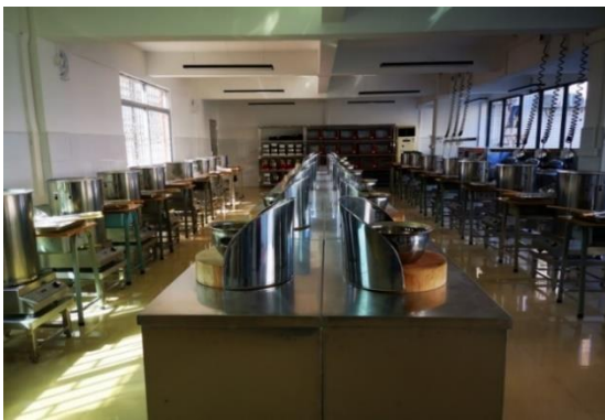
“粤菜师傅”培训基地

多方联动，提高培训质量。学校积极推动“粤菜师傅”项目培训进社区，入村居，紧贴群众的需求开展培训，定期为学校、医院、企业等企事业单位培训厨师厨工。从2021年新“粤菜师傅基地”建成至今，培训鉴定服务量达3800多人次。服务区域覆盖南海各镇街。通过培训和考核提升了社区和农村劳动力的就业创业能力，提高了人民群众的生活水平。