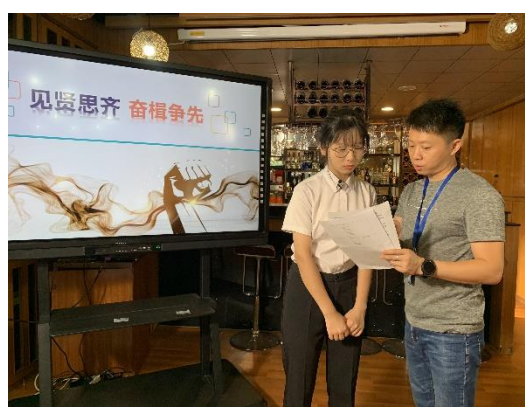
老师辅导学生录制文明文采大赛作品