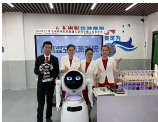
电子商务、计算机团队荣获全国职业院校技能大赛教学能力比赛一等奖