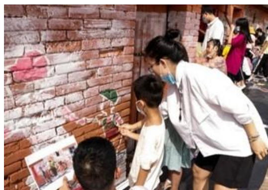
在红星社区开展美化环境活动