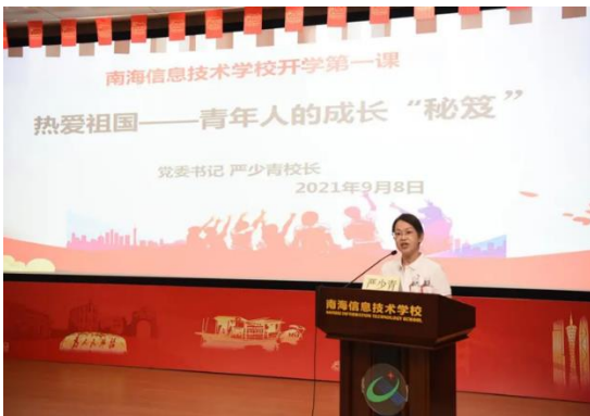
党委书记“开学第一课”

学校努力构建中职特色思政课程育人模式，全面推进“大思政课”，构建发展学生政治素养、健全人格，提高法治意识和公共参与，体现职业教育特点的核心素养课程体系。以庆祝建党 100 周年为主题，各学科结合四史教育、地方红色文化及国情热点进行课程思政专题教育，每学期开展党委书记上开学思政第一课，依托南信“云上大思政课”教育平台，与企业共建青少年思政教育基地，在学校超星平台建设《习近平新时代中国特色社会主义思想 学生读本》和《党史教育》的数字化网络教学资源，以思政核心素养引领，在课堂教学、校会、主题活动、宣传教育等多方面融入党史教育，各专业学科同向同行的课程思政教育正积极推进。