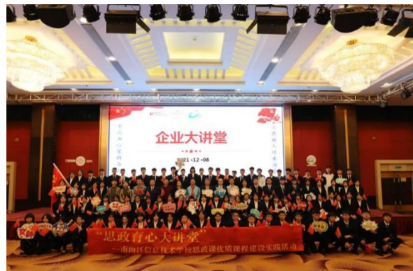
学校党委、佛山宾馆党总支 开展“企业大讲堂”活动