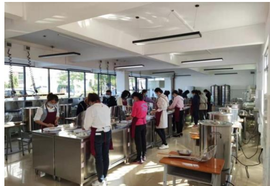
培训学员进行实践操作