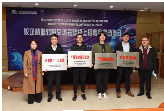
产教融合实训基地授牌