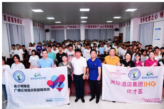
对口帮扶旅游文化产业学院建设