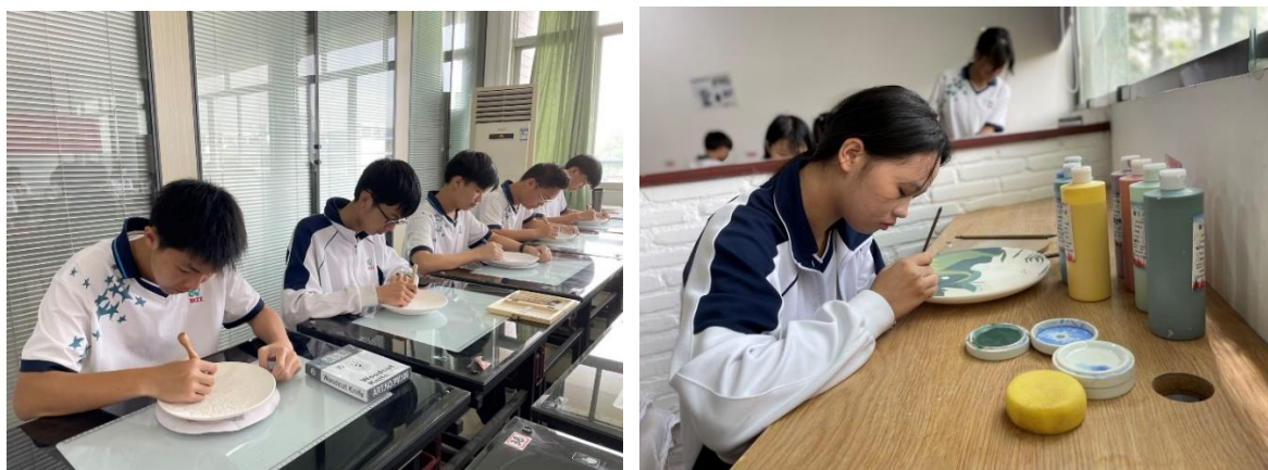
学生在进行“雕塑造型”、“上釉绘画”工序练习

过捏塑、刻划、印花、彩绘等技法的学习，在创作中，认识泥土与火焰带来的变化，享受劳动与手工带来的快乐，激动手与实践的积极性，全面提高了受教育者的素质。同时，通过传授专业知识，培养技术技能，不仅培育了学生的劳动精神、工匠精神，也有效带动佛山陶艺传统技术的传承，进一步培育了青少年对佛山石湾陶文化的了解和热爱，为擦亮“南国陶都”的金字招牌进行了有益探索。