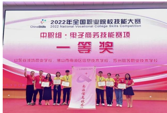
电子商务技能获全国技能大赛一等奖第二名