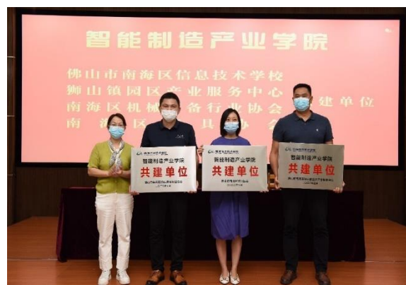
四方共建“智能制造产业学院”签约仪式