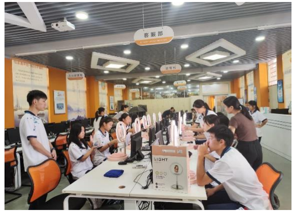
直播基础课程教学