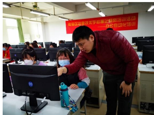
培训老师耐心指导学员

项目推出后，企业职工和社区人员踊跃报名。2022年2月，办公自动化培训项目如期举行，40多名学员参加了培训，培训现场学习氛围浓厚，学员们积极参与理论和实践学习。学员表示，通过培训既学到了知识，又提高了技能水平，对自己和企业的发展都大有好处。三个项目合计开设3门课程35个课时，培训学员120名。学校将继续做好针对企业职工的技能培训，打造示范性职工培训基地，为区域经济发展提供技能人才支撑。