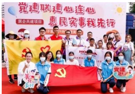
党员志愿服务活动