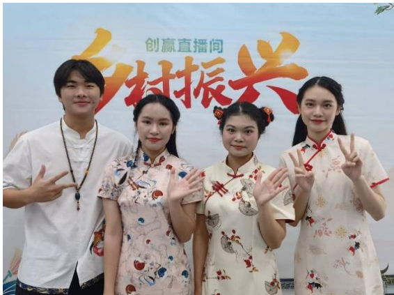
2022 年乡村振兴主题直播

直播电商专业主要面向电子商务和网络营销等行业的业务及管理岗位，以直播电商和网络营销为专业核心技能，通过校企合作共同开发了 20 多门课程，利用品牌导入、专创融合方式，增加学生兴趣，扩展学生知识，提升学生能力，开启了佛山市培养电商直播高素质复合型技术技能人才的新尝试。