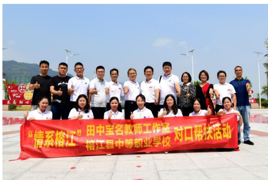
广东省名师工作室到榕江职校对口帮扶

“组团式”帮扶成效明显。精准定位，根据市场产业链需求打造高星级饭店运营与管理专业，完成旅游文化产业学院建设初步工作，专业建设初见成效。以教师队伍建设为“核心点”，全面打造过硬的教师队伍，2022年，榕江职校获得贵州省教学能力比赛一等奖2项，并取得国赛参赛资格；获得贵州省中等职业学校“名班主任”工作室立项。