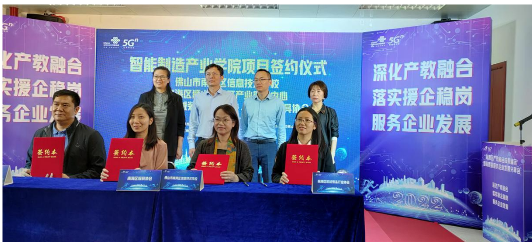
智能制造产业学院项目签约仪式

学校依托各类基地和平台，不断丰富教学模式与场所，协调创新载体，深化产学研，通过共商、共享、共谋，打造产教融合、校企育人的典范，为助推佛山市、南海区智能制造升级、全方位服务地方经济社会发展做出新的更大的贡献。