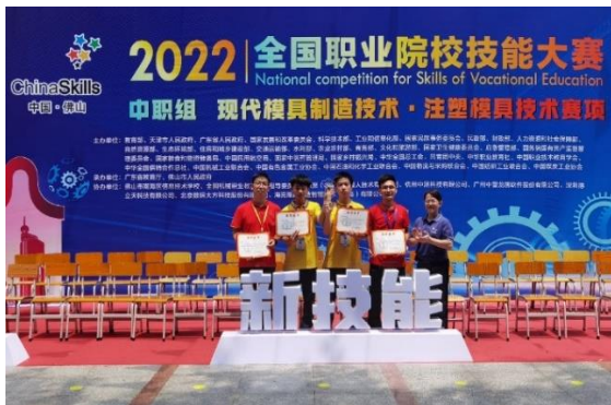
模具赛项获全国技能大赛一等奖第一名