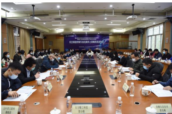
校企精准对接交流会

这次校企精准对接交流会，搭建了企业和院校之间合作的桥梁，推动了“政校行企”之间的紧密沟通和合作，进一步推进了产教融合、校企合作，为佛山市“两高四新”产业发展提供源源不断的人才支撑。