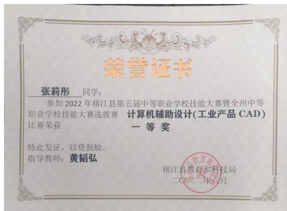
辅导学生获一等奖