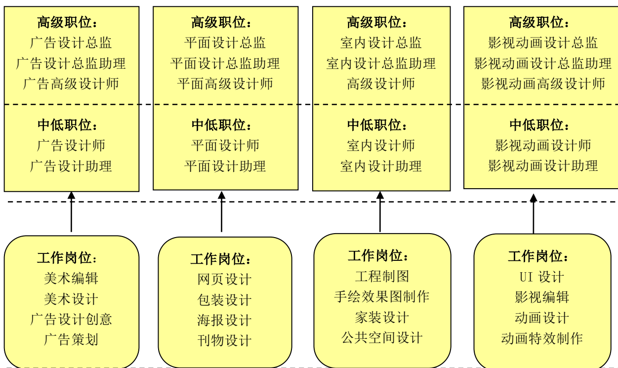
图 1：美术设计与制作专业主要就业岗位